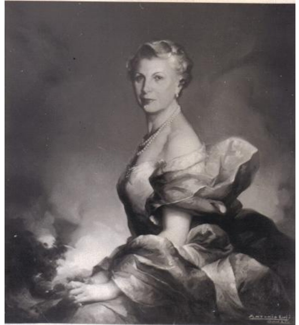
Retrato de su esposa